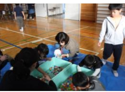
《ボールすくい》 《芯ツムツム》