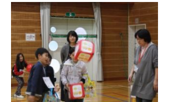
《サイコロ絵合わせ》