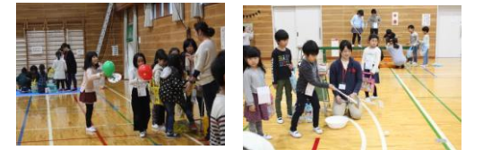
《風船運び》 《ボードボール》

11月10日(土)に「こどもまつり」が体育館で行われました。今年は、9つのゲームコーナーがあり、それぞれの課題をクリアするごとに景品をもらえました。保護者会の皆さんにゲームの担当をしていただき、楽しい時間を過ごすことができました。普段センターを利用していない子どもたちも来て、他の子供たちと仲良く取り組むことができたことはとてもよかったです。