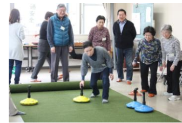
《燃えたユニカール》

「ユニカール」は冬季オリンピックの「カーリング」に似ているということで、3人1組のチームを作り、優勝を争いました。